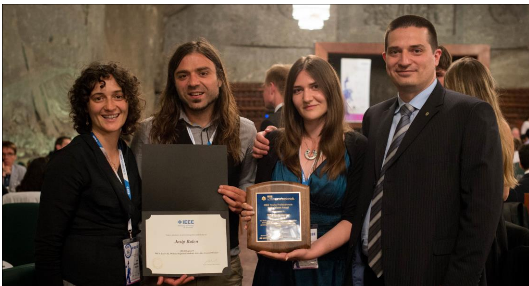
Hrvatski članovi IEEE na Svečanoj večeri održanoj u sklopu Kongresa „IEEE Region 8 Student and Young Professionals“ u Krakowu, 7. kolovoza 2014.

Potrebno je spomenuti kako je slijedom strateških promjena, interesna skupina GOLD (Graduates of the Last Decade) nedavno reorganizirana i preimenovana u „Young Professionals“.